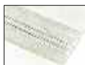
Система крепления со спиральным материалом для сшивания Alligator® Стр. 16