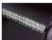
Система стыковки конвейерных лент Alligator® Lacing Стр. 10–13