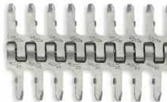
Соединения Alligator® Lacing размера 65