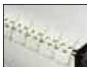
Крепления с пластмассовыми заклепками Alligator® Стр. 14–15