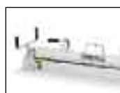
Продукция для технического обслуживания лент Стр. 17–18