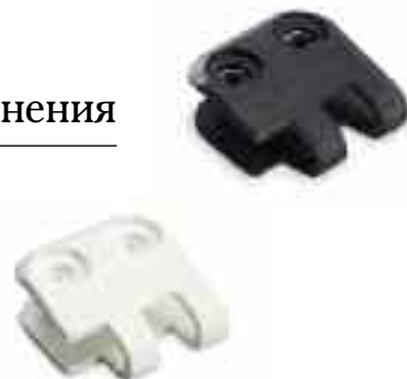
Таблица для выбора системы крепления с пластиковыми заклепками Alligator®

Устойчивый к УФ-излучению черный цвет увеличивает срок службы на открытом воздухе. Белый пластик, одобренный Управлением по контролю за продуктами и лекарствами (FDA), защищает от воздействия слабых растворов кислот, щелочей, углеводов, эфирных растворов и спиртов. Оба материала можно использовать при температурах от -20^{\circ}\text{F} до 180^{\circ}\text{F} ( -29^{\circ}\text{C} до 82^{\circ}\text{C} ).