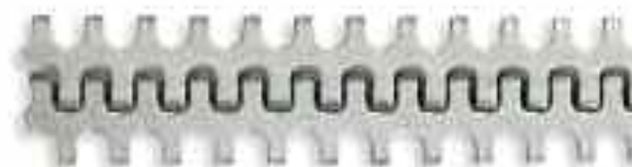
Соединения Alligator® Lacing размера 00

Для плоских приводных ремней толщиной до 300 мм. Материал для сшивания имеет рифление и может отделяться для соответствия лентам с шириной менее указанной на упаковке.