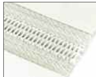
Таблица для выбора спирального материала для шивания Alligator®

Спиральный материал для шивания Alligator® представляет собой неметаллическое соединение с низким профилем, идеально подходящее для машин, требующих частой очистки, машин, используемых для транспортировки хрупких грузов и машин, для которых требуется неабразивное и некрасящее соединение. Шарнирное соединение устанавливается намного легче и быстрее вулканизированного соединения. Его использование также полностью устраняет необходимость разборки конвейера для проведения планового технического обслуживания или ремонта. В ассортименте материалов для разных способов применения имеется белый полиэстер для машин, на которых необходимо использовать материалы, одобренные Управлением по контролю за продуктами и лекарствами (FDA), черный полиэстер для общего использования и PEEK для машин, работающих в среде с высокой температурой.