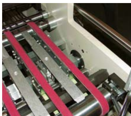
Секция выгрузки картона