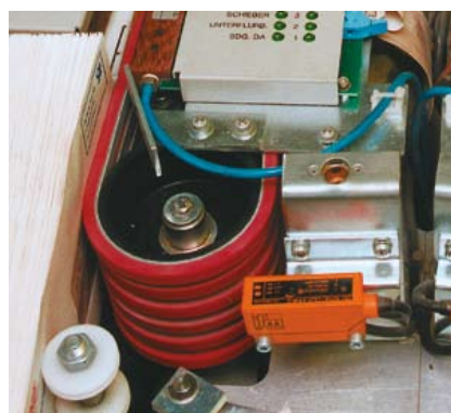
Ремни Siegling Linpack в устройстве для сортировки писем