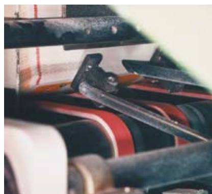
Ускоряющая лента для выгрузки упаковочного материала в производстве картонной упаковки для напитков.