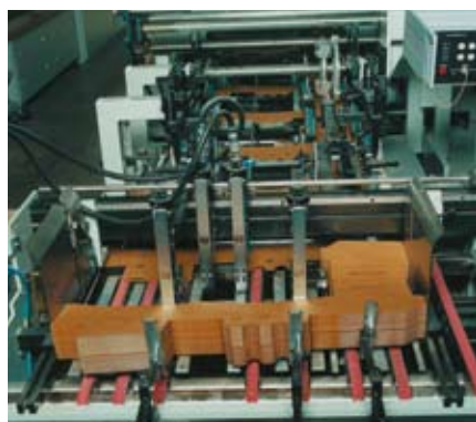
Вакуумная система выгрузки картона с перфорированными ремнями Siegling Linpack